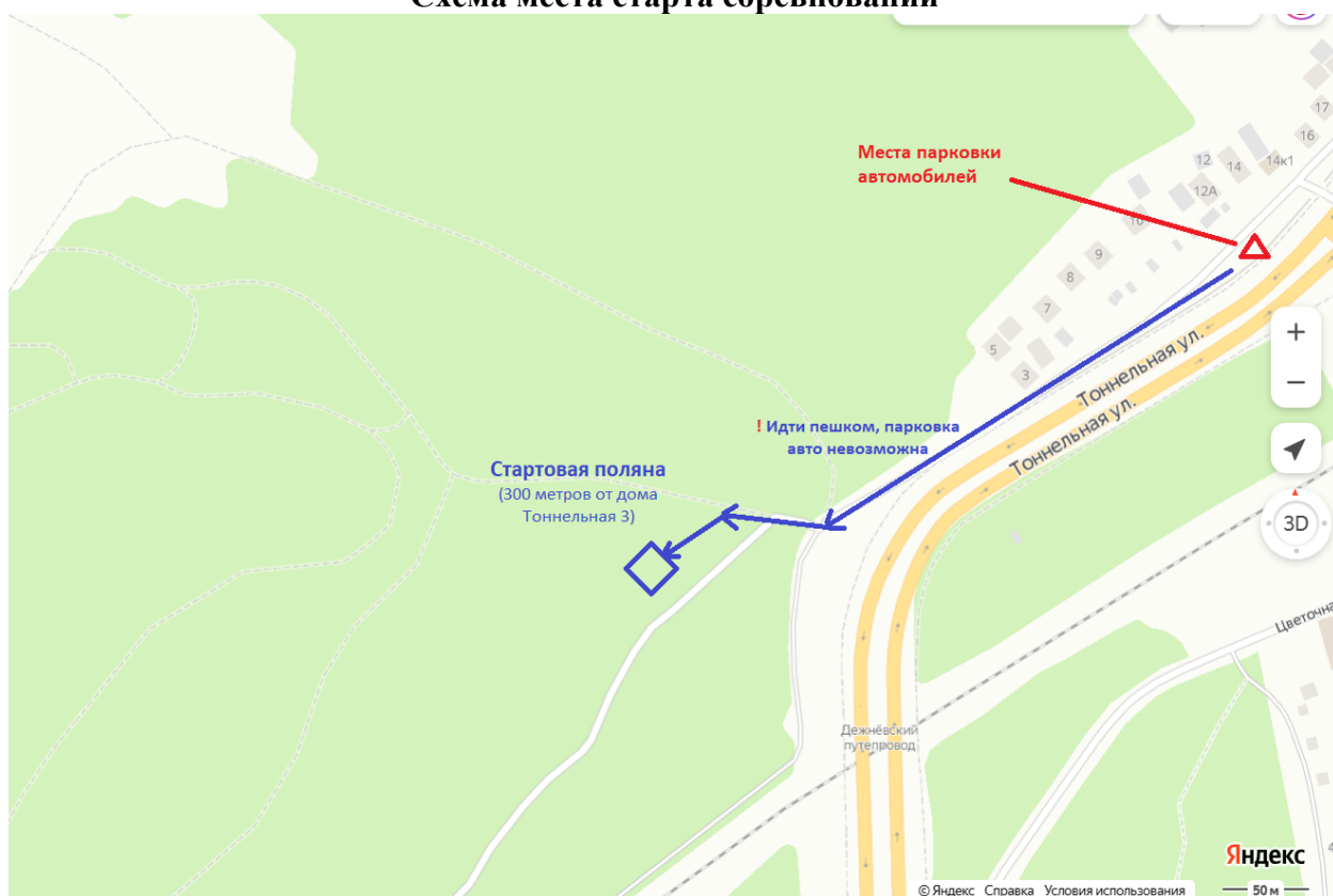
Схема места старта соревнований